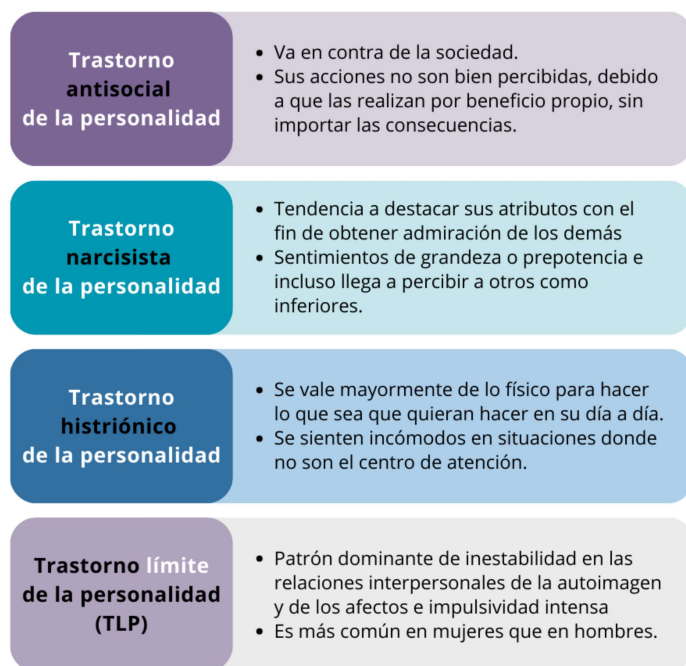
Figura 2. Trastornos de la personalidad grupo B (autora: Grecia Guerrero).

El grupo B incluye cuatro tipos: el trastorno antisocial, el trastorno narcisista, el trastorno histriónico y el trastorno límite (Figura 2).