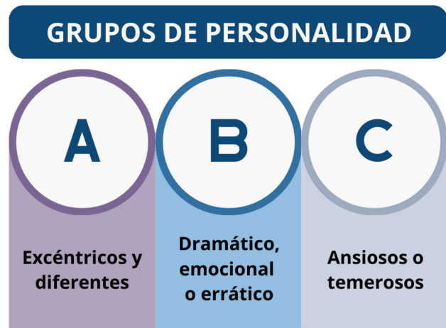
Figura 1. Características de cada grupo de personalidad (autora: Karla Ortega)

En la psicología, las personalidades se dividen en tres grandes grupos o clústers: A, B y C ( Figura 1 ). El grupo A se caracteriza por comportamientos excéntricos y “diferentes”; el grupo B incluye personalidades dramáticas, emocionales o erráticas; mientras que el C agrupa individuos con personalidad ansiosa o temerosa.